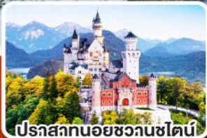
ปราสาทนอยชวานชไตน์