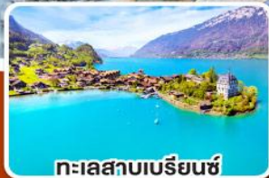
ทะเลสาบเบรีย่นซ์