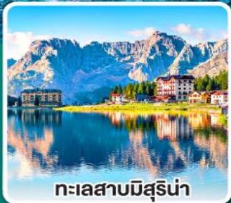
ทะเลสาบมิสุรีน่า

เข้าชมมหาวิหารเซนต์ปีเตอร์ ที่ใหญ่ที่สุดในโลกแห่งนครวาติกัน