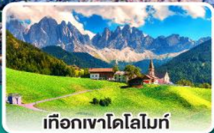
เทือกเขาโดโลไมท์