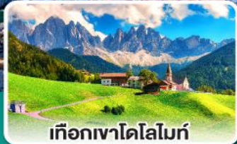
เทือกเขาโดโลไมท์