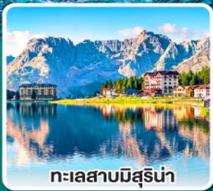
ทะเลสาบมิสุรีน่า

เข้าชมมหาวิหารเซนต์ปีเตอร์ ที่ใหญ่ที่สุดในโลกแห่งนครวาติกัน