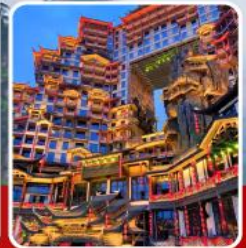
ตึก 72 ชั้น

อุทยานจางเจียเจี๋ย เขาเทียนจื่อซาน สะพานหนึ่งในใต้หล้า ทะเลสาบเป่าเฟิงหู ตึกมหัศจรรย์ 72 ชั้น เมืองโบราณฝู่หรงเจิน เมืองโบราณฝ่งหวง ล่องเรือแม่น้ำถิวเจียง สะพานสายรุ้ง ซุปปิ้ง ถนนคนเดินหวงซิงลู่