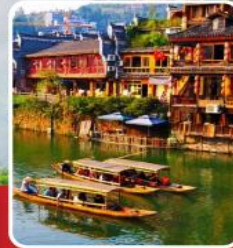
เมืองโบราณฝ่งหวง

เที่ยวฟิน 2 เมืองโบราณ พิชิตเขาวงกต แพนดอร่าของเมืองจีน