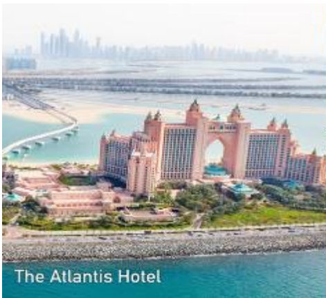
The Atlantis Hotel

นำท่าน นั่งรถไฟ MONORAIL > เดินทางสู่โครงการเดอะปาล์ม THE PALM ซึ่งเป็นโครงการที่อสังการ สุดยอดโปรเจกต์โดยการถมทะเล ให้เป็นเกาะเทียมสร้างเป็นรูปต้นปาล์ม 3 เกาะ บนเกาะมีที่พักโรงแรม รีสอร์ท อพาร์ทเมนท์ ร้านค้า ภัตตาคาร รวมทั้งสำนักงาน ต่าง ๆ นับว่าเป็นสิ่งมหัศจรรย์อันดับ 8 ของโลก