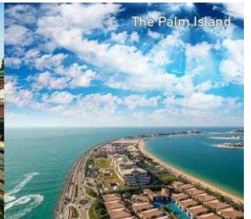
The Palm Island