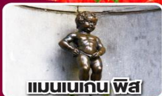
แมนเนเกน ฟิส