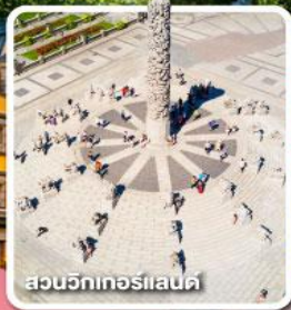
สวนจอกทอร์แลนด