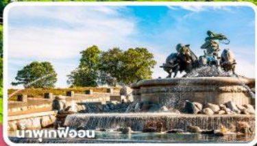
น้ำพุฟอน