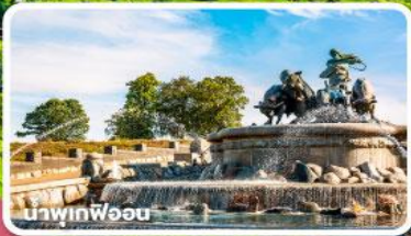
น้ำพุที่ฟ็อน