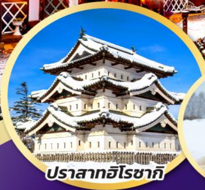
ปราสาทอิโซากิ