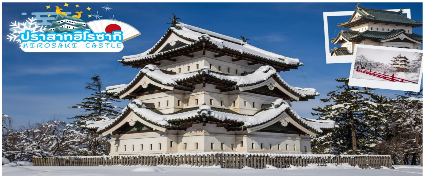
GO2AOJ-JL004 – AOMORI AKITA SENDAI SNOW MONSTER 8D 5N

ปราสาทฮิโรซากิ (Hirosaki Castle) ปราสาทแห่งนี้เป็นสัญลักษณ์ของเมืองฮิโรซากิ สร้างเสร็จในปีค.ศ.1611 โดยแต่เดิมเป็นปราสาทห้าชั้นแล้วถูกฟ้าผ่า ทำให้เกิดไฟไหม้ชั้นห้าจนในปี 1810 มีการบูรณะปราสาทจนเหลือเป็นหอคอยเพียง 3 ชั้น และในปี 1952 ปราสาทแห่งนี้ได้รับการขึ้นทะเบียนเป็นสมบัติแห่งชาติ ในฐานะปราสาทเก่าแก่ในสมัยเอโดะที่ยังหลงเหลืออยู่