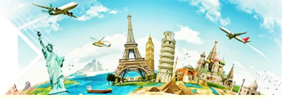
Photo Requirements for Chinese Visa Application