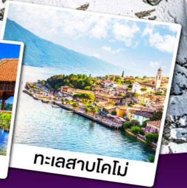
ทะเลสาบโคโม