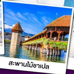
สะพานไม้ชาเปลา