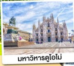
มหาวิหารดูโอโม

28 ม.ค. - 03 ก.พ. 68 12-18 มี.ค. 68 11-17 เม.ย. 68 07-13 พ.ค. 68