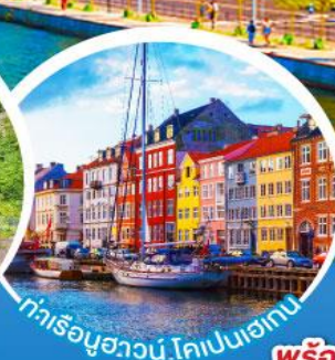
ท่าเรือฮาวน์.ไทเปเนเจอร์

เดินทาง 18-27 มี.ค. 68 10-19, 11-20 เม.ย. 68 02-11, 16-25 พ.ค. 68