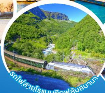
รถไฟสายโรแมนติกฟลัมสบานา