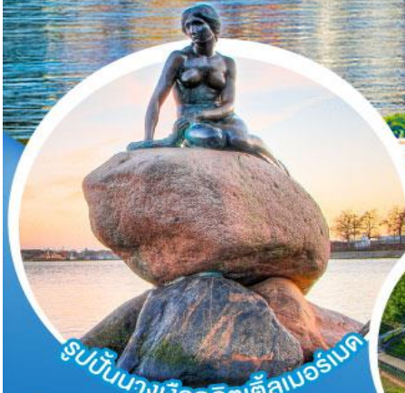
รูปปั้นนางเงือกลิตเติลเบอร์เนต