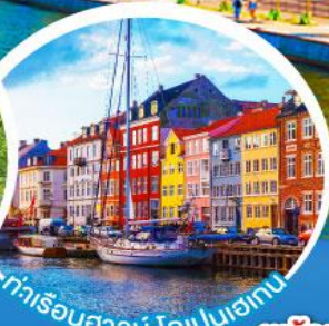
ท่าเรือฮาวน์.ไทเปเฮเกน

เดินทาง 18-27 มี.ค. 68 10-19, 11-20 เม.ย. 68 02-11, 16-25 พ.ค. 68