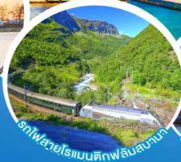
รถไฟสายโรแมนติกฟลัมสบานา