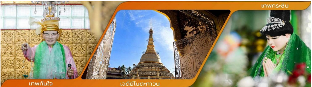
เทพทันใจ

วิธีการสักการะรูปปั้นเทพทันใจ (นัตโบโบยี) เพื่อขอสิ่งใดแล้วสมตามความปรารถนาก็ให้เอาดอกไม้ ผลไม้ โดยเฉพาะมะพร้าวอ่อน กล้วย จากนั้นก็ให้เอาเงินจะเป็นดอลลาร์ บาท หรือจ๊าด ก็ได้ แล้วเอาไปใส่มือของนัตโบโบยี 2 ใบ ไหว้ขอพรแล้วดิกกลับมา 1 ใบ เอามาเก็บรักษาไว้ จากนั้นก็เอาหน้าผากไปแตะกับนิ้วชี้ของนัตโบโบยี แค่นี้ท่านก็จะสมตามความปรารถนาที่ตั้งใจไว้ คำบูชาเทพทันใจ เอหิ สักกะ महानัทโปะโปะจีโปตะถ่องสิทธิมัตถุ อิทังพะลัง เอตัสสะมิงรัตตะนัง พุทธัง ธัมมัง สังฆัง เทวานัง ประสิทธิลาภो ขยโยนิจจัง วันทามิสัพพะทา สวาโหม