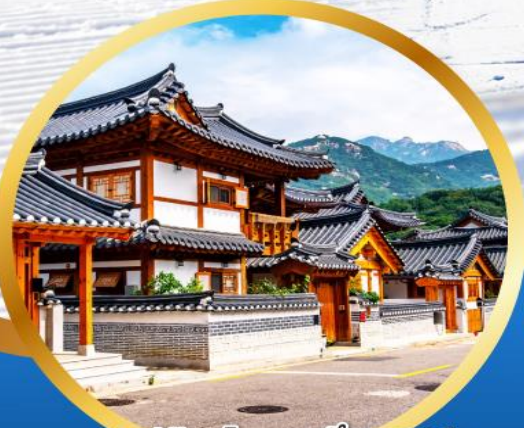
หมู่บ้านโบราณอันสวยงาม