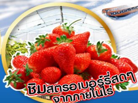
ชิมสตรอเบอร์รี่สดๆ จากภายในไร่