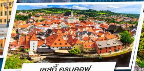
เชสกี ครุมลอฟ