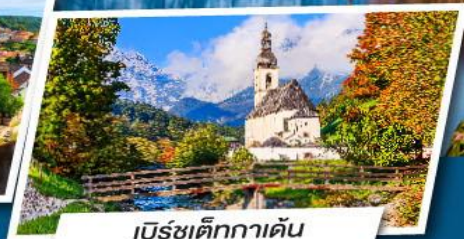
เบิร์ชเต็กกาเดิน