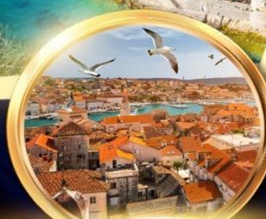
Historic city of Trogir