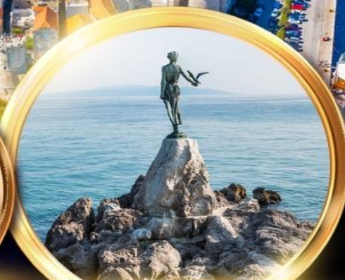
Maiden with the Seagull