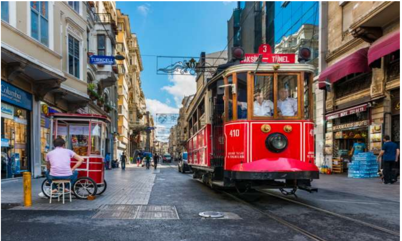
หน้า 15 (ภาพใช้เพื่อการโฆษณาเท่านั้น)

ต่อจากนั้นนำท่านไปช้อปปิ้งสุดมันส์เต็มอิมม์กับบรรยากาศอันคึกคักของ จัตุรัสทักซิมสแควร์ (Taksim Square) ถนนสายนี้เรียกได้ว่าเป็นจุดศูนย์กลางของเมืองอิสตันบูล มีร้านค้ามากมาย เช่น H&M,ZARA,MANGO,NIKE,ADIDAS etc., ร้านอาหารพื้นเมือง และยังมีแรมป์โบราณ (Tram) เรียกได้ว่าที่แห่งนี้เป็นจุดนัดพบยอดนิยมของชาวเมืองอิสตันบูล