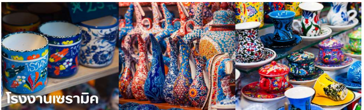
โรงงานเซรามิค

จากนั้นนำท่านแวะ ชมโรงงานจิวเวลรี่ โรงงานพรม และโรงงานเซรามิค อิสระกับการเลือกซื้อสินค้าและของที่ระลึก