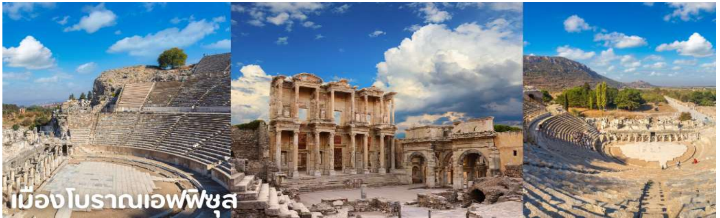
เมืองโบราณเอเฟซุส

จากนั้นนำทุกท่านเข้าชม เมืองโบราณเอเฟซุส เมืองโบราณที่มีการบำรุงรักษาไว้เป็นอย่างดีเมืองหนึ่ง เคยเป็นที่อยู่ของชาวไอโอนิก (Ionia) จากกรีก ซึ่งอพยพเข้ามาปักหลักสร้างเมือง ซึ่งรุ่งเรืองขึ้นในศตวรรษที่ 6 ก่อนคริสตกาล ต่อมาถูกรุกรานเข้ายึดครองโดยพวกเปอร์เซียและกษัตริย์อเล็กซานเดอร์มหาราช ภายหลังเมื่อโรมันเข้าครอบครองก็ได้สถาปนาเอเฟซุสขึ้นเป็นเมืองหลวงต่างจังหวัดของโรมัน นำท่านเดินบนถนนหินอ่อนผ่านใจกลางเมืองเก่าที่สองข้างทางเต็มไปด้วยซากสิ่งก่อสร้างเมื่อสมัย 2,000 ปีที่แล้ว ไม่ว่าจะเป็นโรงละครกลางแจ้งที่สามารถจุผู้ชมได้กว่า 30,000 คน ซึ่งยังคงใช้งานได้จนถึงปัจจุบันนี้ นำท่านชม ห้องอาบน้ำแบบโรมันโบราณ (ROMAN BATH) ที่ยังคงเหลือร่องรอยของห้องอบไอน้ำ ให้เห็นอยู่จนถึงทุกวันนี้, ห้องสมุดโบราณ ที่มีวิธีการเก็บรักษาหนังสือไว้ได้เป็นอย่างดีทุกสิ่งทุกอย่างล้วนเป็นศิลปะแบบ เฮเลนนิสติกที่มีความอ่อนหวานและฝีมือประณีต