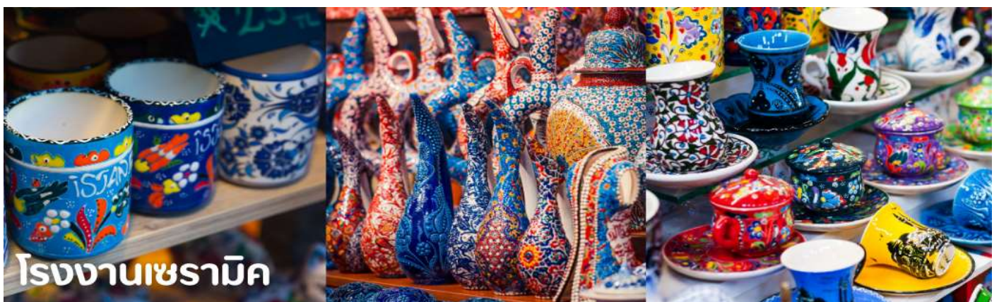
โรงงานเซรามิค