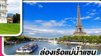
ล่องเรือแม่น้ำแซน