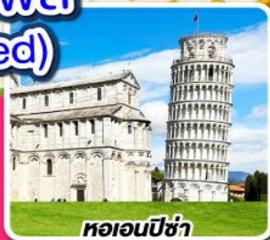
หอเอนปิซ่า