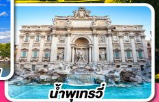
น้ำพุทวี