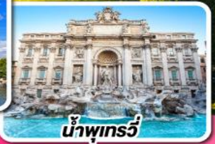
น้ำพุทรวี่

04-13 ธ.ค. 67 27 ธ.ค. 67-05 ม.ค. 68 (ปีใหม่) 28 ธ.ค. 67-06 ม.ค. 68 (ปีใหม่) 28 ม.ค.-06 ก.พ. 68