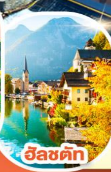
อินส์บรอก