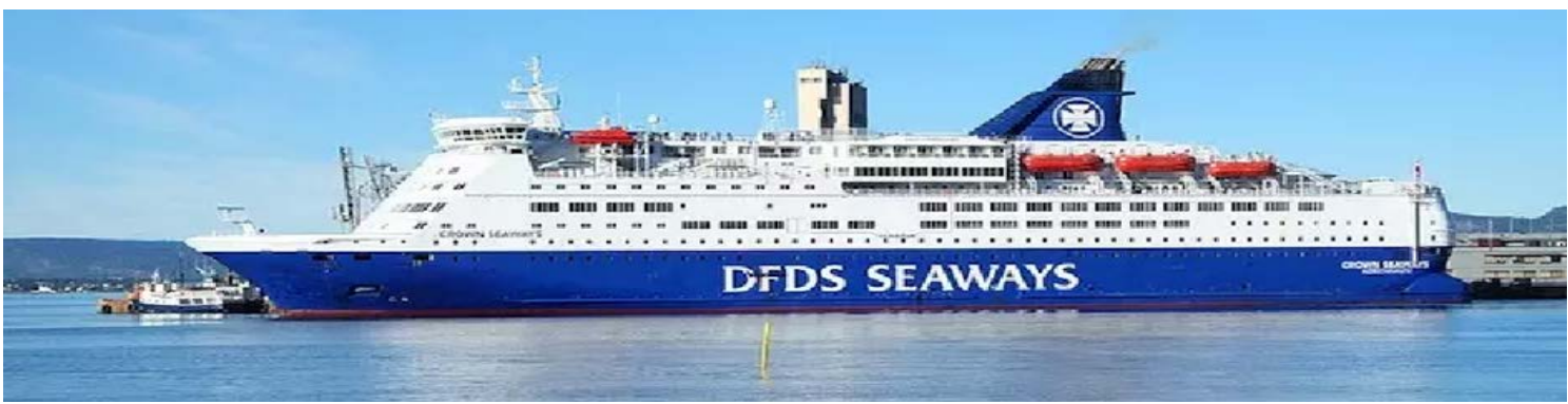
นำคณะพักบน เรือสำราญ SCANDINAVIAN SEAWAYS (Overnight Cruise) ห้องพักรู้

18.00 น. รับประทานอาหารค่ำแบบ "สแกนดิเนเวียนบุฟเฟ่ต์" ณ ภัตตาคารบนเรือสำราญ (มื้อที่ 13)