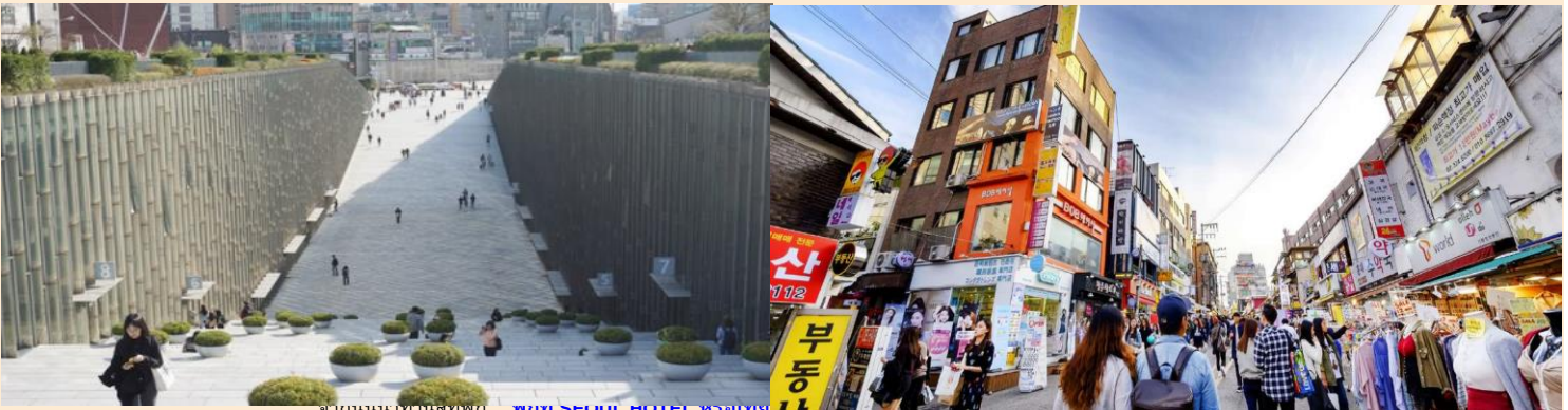
จากถนนเทรนสู่ที่พัก... พักที่ SEOUL HOTEL หรือเทียบเท่า 5 พัก

เช่น ครีมวานหางจะเข้ ย้าย่อมม สมานด์ครีม ยาสะระม เป็นต้น นำท่านเดินทางสู่ ย่านฮงแด (Hongdae) เป็นย่านช้อปปิ้งบริเวณด้านหน้าของมหาวิทยาลัย ซงฮก ศูนย์รวมเด็กวัยรุ่น เด็กมหาวิทยาลัยและวัยทำงาน นิยมมาเดินเล่น ราคาของสินค้าและร้านอาหารต่าง ๆ ก็ไม่แพง ซึ่งจะคึกคักเป็นพิเศษตั้งแต่ช่วงบ่ายเป็นต้นไป เพราะร้านแต่ละร้านจะทยอยเปิดให้บริการ ของที่ขายกันเยอะส่วนใหญ่อะจะเป็นสินค้าแฟชั่น เช่น เสื้อผ้า กระเป๋า รองเท้า กีฬช้อป เครื่องเขียน และขนมหลากหลายชนิด