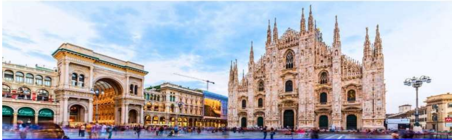
GG30 แกรนด์อิตาลี 9 วัน 6 คืน

นำท่านชม มหาวิหารแห่งเมืองมิลาน หรือที่เรียกว่า ดุโอโม ชื่อนี้ไว้ใช้เรียกมหาวิหารประจำเมือง แถบจะมีดุโอโมทุกเมืองที่สำคัญๆ เป็นจุดศูนย์รวมจิตใจของคนในเมือง ดุโอโมที่เมืองนี้สร้างในสถาปัตยกรรมแบบโกธิค เป็นมหาวิหารที่ใหญ่เป็นอันดับ 2 รองจากมหาวิหารเซนต์ปีเตอร์ในกรุงวาติกัน มหาวิหารแห่งนี้เริ่มสร้างขึ้นในปี ค.ศ. 1386 แต่มาแล้วเสร็จ 400 กว่าปีหลังจากนั้นคือในปี ค.ศ. 1813 ด้านนอกเป็นยอดแหลม 135 ยอด จึงมีชื่อเล่นว่า มหาวิหารแม่ มีรูปสลักหินอ่อนจากยุคต่าง ๆ ประดับอยู่กว่าสามพันรูปยอดที่สูงที่สุดประดับด้วยรูปสลักพระแม่มาเรียสูง 4 เมตร หุ้มด้วยทองคำกึ่งองค์ มีชื่อเรียกว่า มาดอนนิน่า ด้านหน้ามหาวิหารจะเป็นลานกว้าง เรียกว่า ปิอาซซา เดล ดุโอโม เป็นศูนย์กลางเป็นแหล่งชุมนุมของผู้คนมาทุกยุคสมัย ด้านข้างของจัตุรัสหน้าดุโอโมทางทิศเหนือ จะเห็นทางเข้า แกลเลอเรีย วัตโตริโอ เอมานุเอล ซึ่งเป็นศูนย์กลางการค้าที่หรูหราอลังการแห่งเมืองมิลาน ให้ท่านอิสระในการช้อปปิ้งภายในห้างเป็นโดมแก้ว มีห้างร้านต่าง ๆ มากมาย คล้ายกับอีกแห่งที่เมืองเนเปิลส์ ทะลุออกมาอีกด้านจะเจอโรงอุปรากรชื่อก้องโลก ลา สกาล่า แห่งเมืองมิลาน สร้างขึ้นระหว่างปี ค.ศ. 1776 - 1778 ด้านหน้าลานสกาล่า เรียกว่า ปิอาซซา เดลลา สกาล่า มีรูปปั้นของศิลปินที่มีชื่อเสียงโด่งดังคนหนึ่งของโลก คือลีโอนาร์โด ดา วินชี