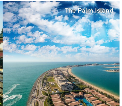
The Palm Island