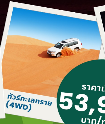
ทัวร์ทะเลทราย (4WD)