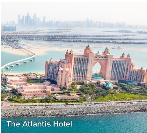
The Atlantis Hotel

นำท่าน นั่งรถไฟ MONORAIL > เดินทางสู่โครงการเดอะปาล์ม THE PALM ซึ่งเป็นโครงการที่อสังการ สุดยอดโปรเจกต์โดยการถมทะเล ให้เป็นเกาะเทียมสร้างเป็นรูปต้นปาล์ม 3 เกาะ บนเกาะมีที่พักโรงแรม รีสอร์ท อพาร์ทเมนท์ ร้านค้า ภัตตาคาร รวมทั้งสำนักงาน ต่าง ๆ นับว่าเป็นสิ่งมหัศจรรย์อันดับ 8 ของโลก