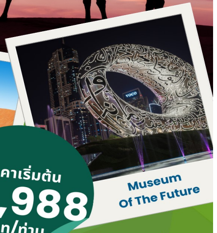
Museum Of The Future