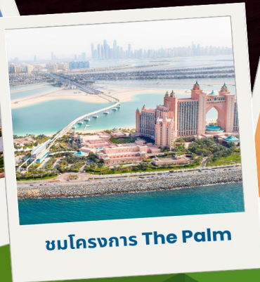
ชมโครงการ The Palm