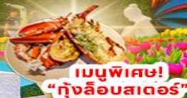
เมนูพิเศษ! "กึ่งลิอบสเตอร์"