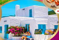
มารีนา คาเฟ่