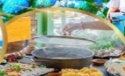
พิเศษ บุฟเฟต์ 2 มือ