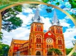
โบสถ์นอร์ทโรดาม