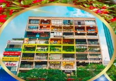
คอฟฟี่ อพาร์ทเมนต์