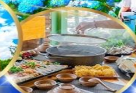
พิเศษ บุฟเฟต์ 2 มื้อ