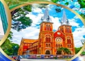
โบสถ์นอร์ทเธอดาม