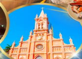
โบสถ์สีชมพู