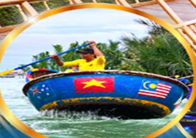
ล่องเรือกระดังง์