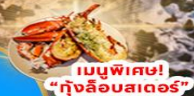
เมนูพิเศษ! "กุ้งล็อบสเตอร์"