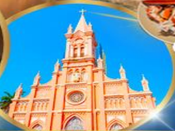
โบสถ์สีชมพู