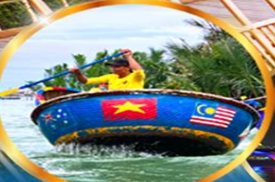
ล่องเรือกระดังง์