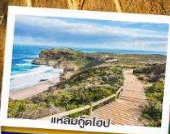
แหลมกู๊ดโฮป