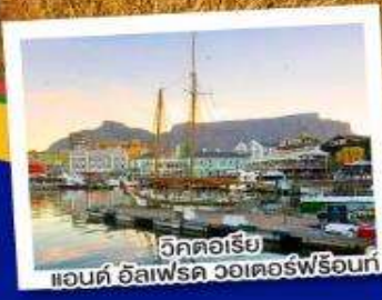
วิกตอเรีย แอนดอ์อัลเฟรด วอเตอร์ฟรอนท์