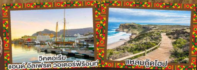
วิกตอเรีย แอนด์ อัลเฟรด วอเตอร์ฟรอนท์

เปิดประสบการณ์กับภัตตาคาร Carnivore สวรรค์ของคนรักเนื้อสัตว์