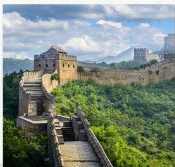
กำแพงเมืองจีน ด่านจวิหยงกวน