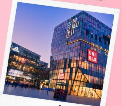
ซานหลี่กุน