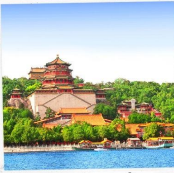
พระราชวังฤดูร้อน อวิเหอหยวน