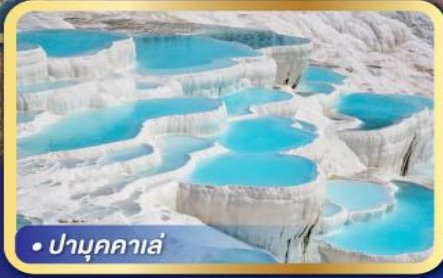
• ปามุกคาเล่