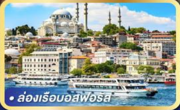
• ล่องเรือบอสฟอรัส