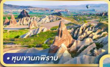
• หุบเขากพริราบ