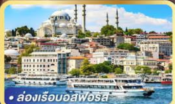
• ส่องเรือบอสฟอรัส