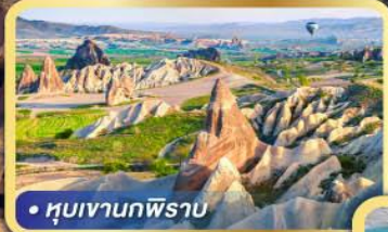
• หุบเขานกฟิราบ