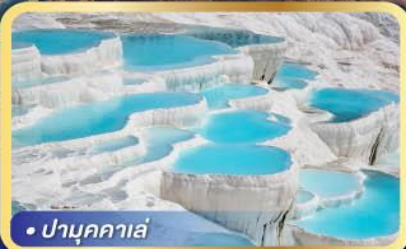
• ปามุกคาล่