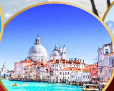
ล่องเรือสู่เกาะเวนิส