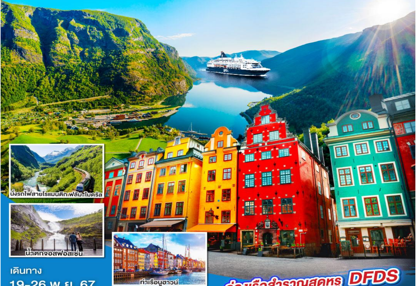
นึ่งรถไฟสายโรแมนติกเฟลิมโบคริส

น้ำตกอลังการ เรือสำราญ Sea View 8 วัน 5 คืน