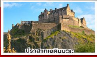
ปราสาทเอดิเนบะระ

เยือนสโตนเฮ็นจ์ และ พิพิธภัณฑที่โรมันโบราณ