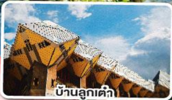
บ้านลูกเต่า