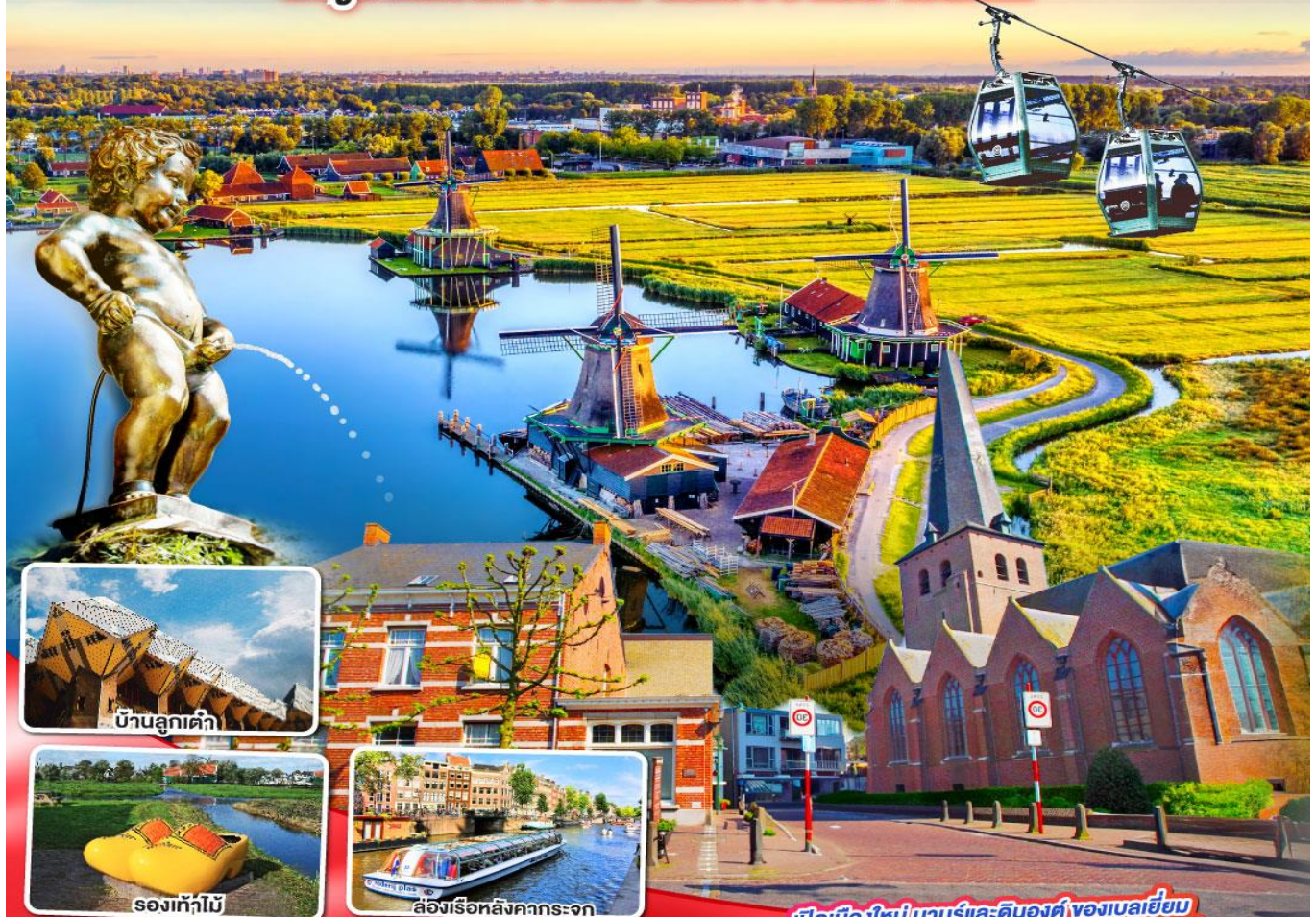
บ้านลูกเต๋า

นาบูร์ ดินองต์ บารส์-นัสซา บารส์-เฮร์ตโท