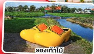
รองเท้าไม้