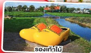
รองเท้าไม้