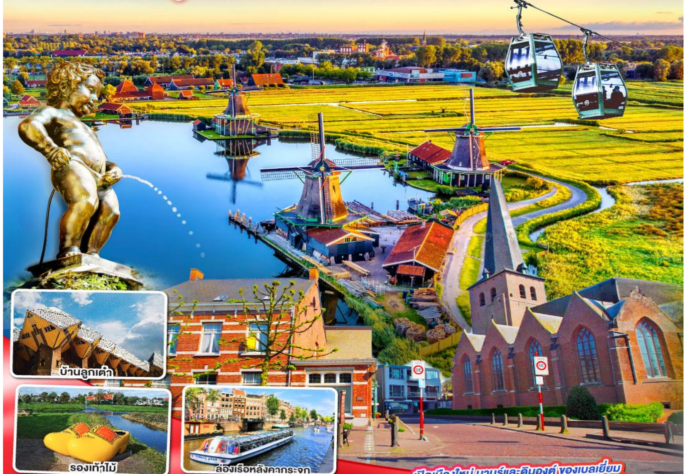
บ้านลูกเต๋า

นามูร์ ดินองต์ บารส์-นัสซา บารส์-เฮร์ตโท