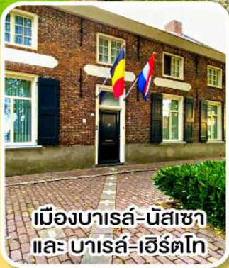
เมืองบารส์-นัสซา และ บารส์-เฮิร์ตโท