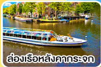
ล่องเรือหลังคากระจก

พิเศษ!! เมนูหอยแมลงภู่อบไวน์ขาว ล่องเรือหมู่บ้านไรกันน ที่รูร์น