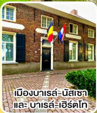
เมืองบารส์-นัสซา และ บารส์-เฮิร์ตโท