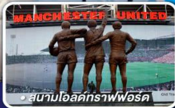
● สนามโอลด์แทรฟฟอร์ด

● ถ่ายรูปสนามฟุตบอลแอนฟิลด์ สนามฟุตบอลโอลด์แทรฟฟอร์ด