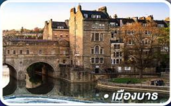
● เมืองบาร