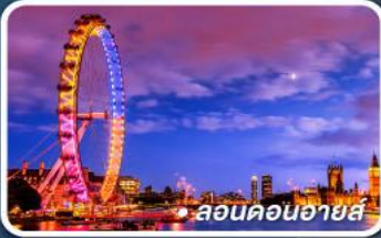
● ลอนดอนอายส์

● บินลงแมนเชสเตอร์ กลับที่ลอนดอน ไม่ย้อนเส้นทาง