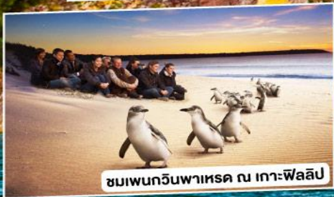
ชมเพนกวินพาเหรด ณ เกาะฟิลลิป