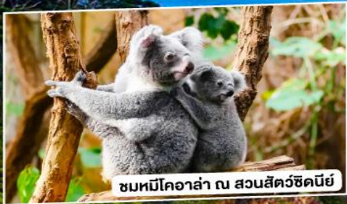
ชมหมีโคอาล่า ณ สวนสัตว์ซิดนีย์

อิสระเต็มอัมแบบ 1 วันเต็ม ณ มหานครซิดนีย์