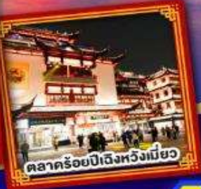
ตลาดร้อยปีถึงหวังเหมียว