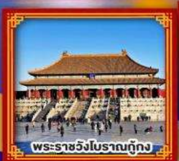
พระราชวังโบราณกู้กิง