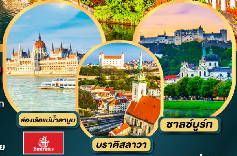
ล่องเรือแม่น้ำดานูบ