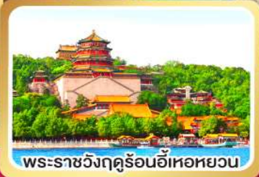
พระราชวังฤดูร้อนอีเหอหยวน