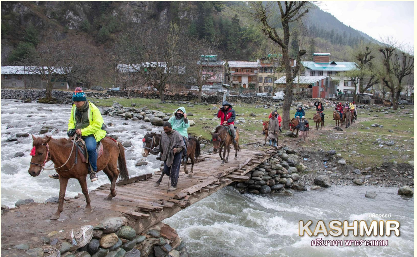
บัทจอสย์ KASHMIR ศรีนาคา พาชาลเทศ

จากนั้น นำท่านเดินทางกลับสู่เมืองศรีนาคา เย็น ๓๑ บริการอาหารเย็น ณ ที่พัก HOUSEBOAT จากนั้น ที่พักที่ Houseboat หรือเทียบเท่า มาตรฐาน เมืองศรีนาคา (โรงแรมที่ระบุในรายการทัวร์เป็น เพียงโรงแรมที่นำเสนอเบื้องต้นเท่านั้น ซึ่งอาจมีการ เปลี่ยนแปลงแต่โรงแรมที่เข้าพักจะเป็นโรงแรมระดับ เทียบเท่ากัน)