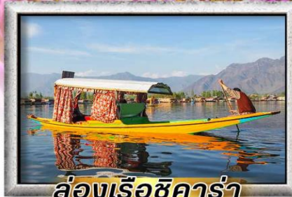
ล่องเรือชิคาร่า