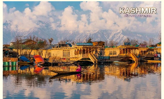
KASHMIR ศรีนาคา พาชาลเทศ

จากนั้น นำท่านเดินทางกลับสู่เมืองศรีนาคา เย็น ๓๑ บริการอาหารเย็น ณ ที่พัก HOUSEBOAT จากนั้น ที่พักที่ Houseboat หรือเทียบเท่า มาตรฐาน เมืองศรีนาคา (โรงแรมที่ระบุในรายการทัวร์เป็น เพียงโรงแรมที่นำเสนอเบื้องต้นเท่านั้น ซึ่งอาจมีการ เปลี่ยนแปลงแต่โรงแรมที่เข้าพักจะเป็นโรงแรมระดับ เทียบเท่ากัน)