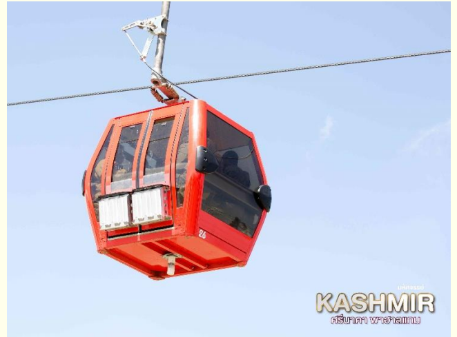
KASHMIR ศรีนาคา พาราไดซั่ม

นำท่านสู่ กุลมาร์ค (Gulmarg) หรือ“แดนทุ่งหญ้าแห่งดอกไม้ (Meadow of Gold)” ด้วยทัศนียภาพที่สวยงามและถือเป็นความงดงามที่มาจากธรรมชาติอย่างแท้จริง สามารถเที่ยวชมได้ทุกฤดู จัดเป็นสถานที่ที่ต้องมาให้ได้สักครั้งในชีวิต นำท่านไปยัง สถานีกุลมาร์ค กอนโคล่า ชมเทือกเขากุลมาร์ค นั่งกระเช้าลอยฟ้าที่สูงที่สุดในโลกด้วย