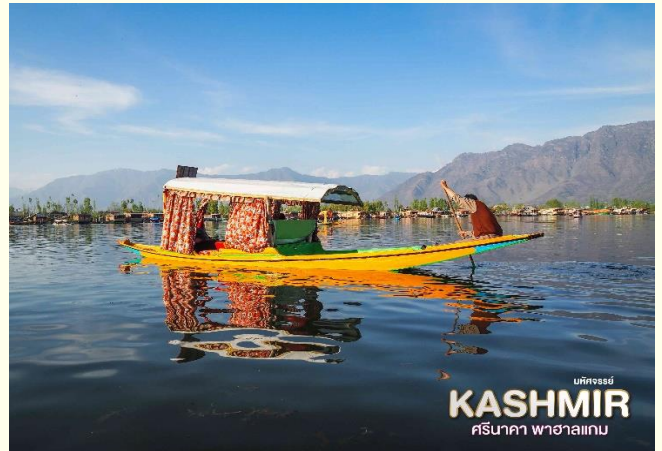
KASHMIR ศรีนาคา พาราไดซั่ม

นำท่านเดินทางกลับสู่ เมืองศรีนาคา เดินทางสู่ ทะเลสาบดาล (Dal Lake) ทะเลสาบที่ใหญ่ที่สุดในรัฐแคชเมียร์ และเป็นทะเลสาบที่มีชื่อเสียงที่สุดในแคชเมียร์ ในตอนเช้าของเมืองนี้จะมีพ่อค้าแม่ค้า ล่องเรือมาขายเป็นตลาดดอกไม้และเป็นวิถีชีวิตในตอนเช้าที่ทะเลสาบดาล พิเศษ!!! นำ