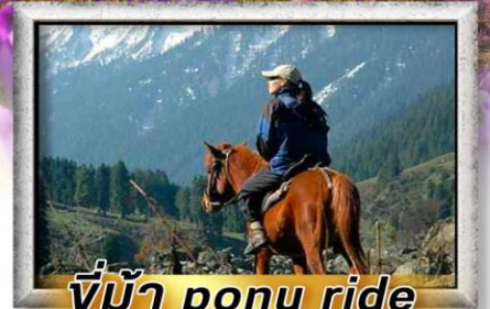
ขี่ม้า pony ride