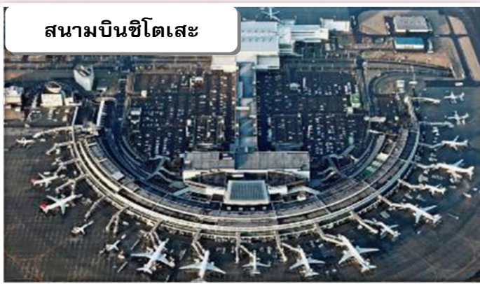
สนามบินชิตเสะ

เวลา 10.40 น. เดินทางถึง สนามบินชิตเสะ นำท่านผ่านขั้นตอนการตรวจคนเข้าเมืองและศุลกากร